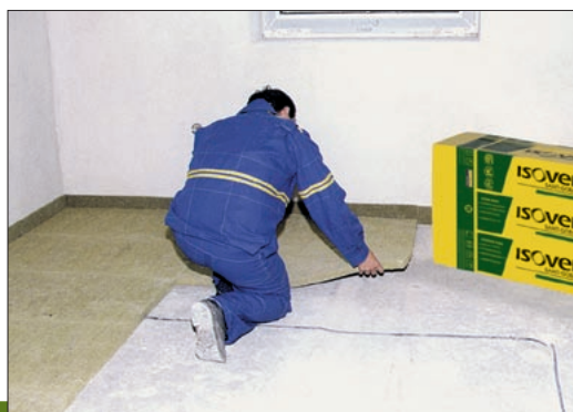
Ukázka aplikace výrobku Isover T-P

6) FU = funkční jednotka (1 m 2 izolace o tloušťce 25 mm při započítaných fázích životního cyklu A1-A3).